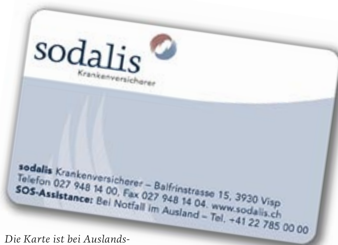
Die Karte ist bei Auslandsaufenthalten unbedingt mitzunehmen.

SOS-Assistance: Auf der Vorderseite Ihrer neuen Versicherungskarte finden Sie die Telefonnummer der Notfallzentrale unseres Partners SOS-Assistance. Bitte setzen Sie sich bei Notfällen im Ausland unverzüglich mit der SOS-Assistance (Telefonnummer +41 88 719 11 00) in Verbindung. Diese 24-Stunden Soforthilfe steht Ihnen im Falle medizinischer Notlagen im Ausland (z.B. akuter stationärer Spitalaufenthalt) weltweit während 365 Tagen mit Rat und Tat zur Seite, informiert Sie über die weitere Vorgehensweise, erteilt Kostengarantien und ist verantwortlich für eine allfällige Repatriierung in die Schweiz. Wichtig: die konkrete Kostenübernahme der beanspruchten